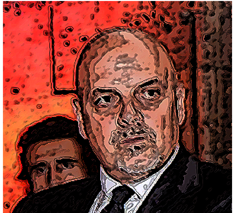
UN FRESCONE DI LUCA DELLA SUBBIA