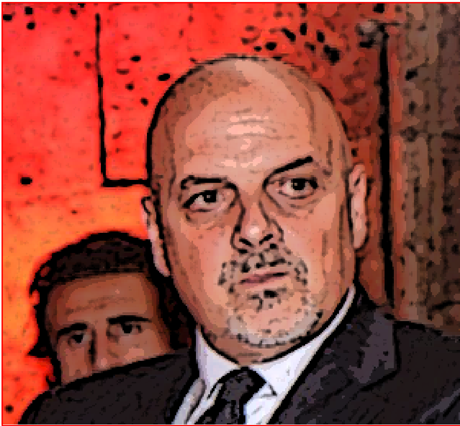
UN AFFRESCO DI LUCA DELLA SABBIA